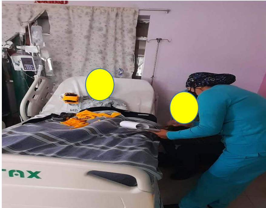
Explicación de en qué se basa la encuesta a madre de un niño hospitalizado