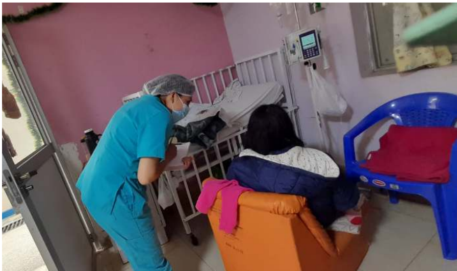
Aplicación de encuesta sobre el estrés y participación a madre del niño hospitalizado en el hospital el Carmen Huancayo.