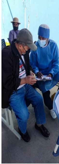
Encuestando al paciente Después de ser atendido.