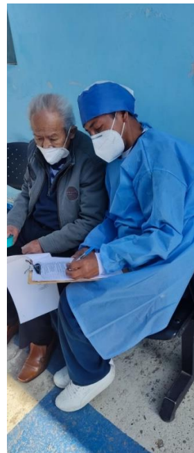
Encuestando en la sala de espera antes de ser atendido.