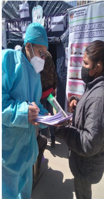
Encuestando en la campaña de salud bucal en el H.D.C.Q.D.A.C. HYO.