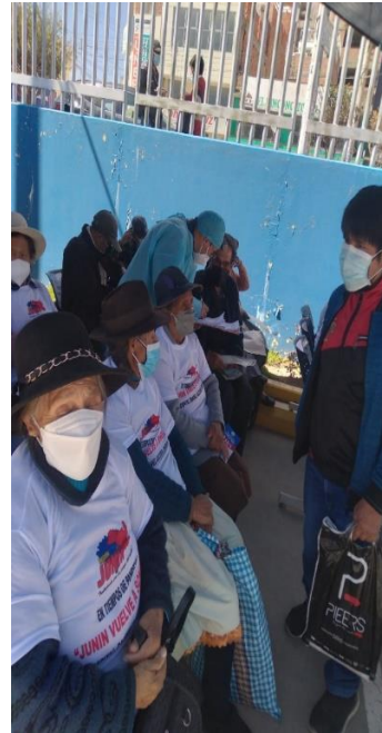
Encuestando a los adultos mayores en la campaña Junín sonrío en el H.D.C.Q.D.A.C. HYO.