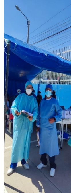
Mi colega y yo después de las encuestas a los pacientes.