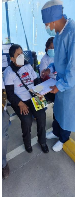
Aquí encuestando al paciente. Antes de ser atendido.