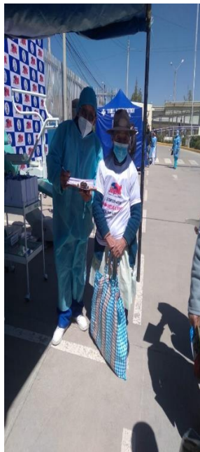
Por prevención a la aglomeración en consultorios externos, encuestando en el patio del H.D.C.Q.D.A.C. HYO.