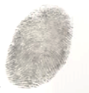
FIRMA DE AUTOR