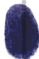
FIRMA DE AUTOR