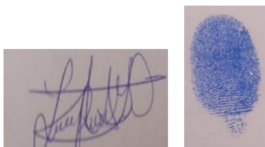
FIRMA DE AUTOR

Por constancia se firma el presente documento en la ciudad de Huancayo, a los 14 días del mes de marzo del 2024.