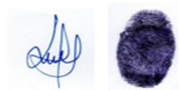
FIRMA DE AUTOR

Por constancia se firma el presente documento en la ciudad de Huancayo, a los 29 días del mes de mayo del 2024.