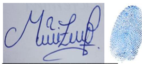
FIRMA DE AUTOR